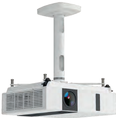
Kindermann Comfort 2 30